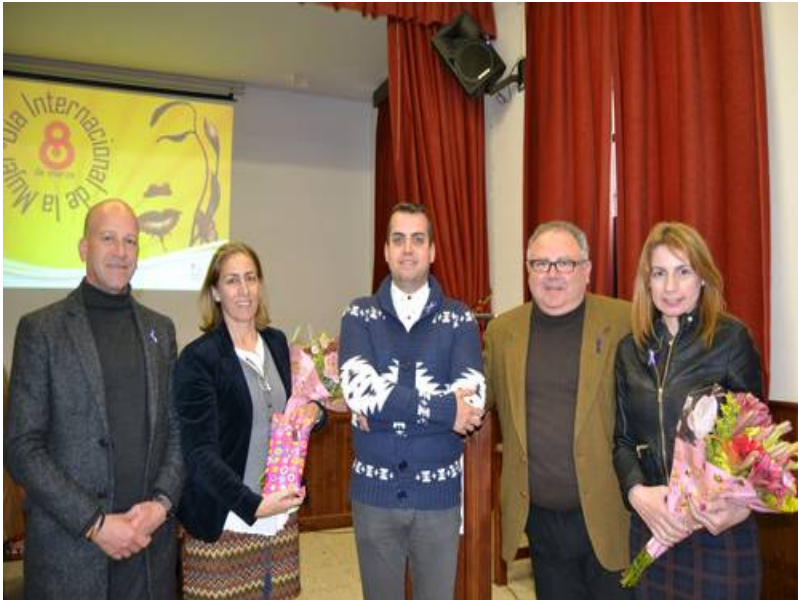
( http://www.calanas.es/export/sites/calanas/es/.galleries/imagenes-noticias/2016/marzo2016/8MARZO-02.jpg )