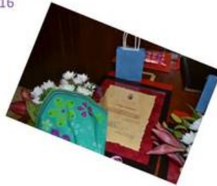
( http://www.calanas.es/export/sites/calanas/es/.galleries/imagenes-noticias/2016/marzo2016/8MARZO-03.jpg )