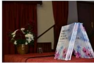
8 de marzo, DÍA DE LA MUJER 2016